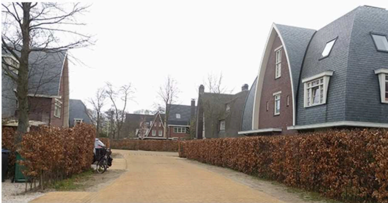
Een goede balans tussen verscheidenheid en uniformiteit zorgt voor een aantrekkelijke omgeving. Dit geldt voor zowel architectuur als in de buitenruimte.