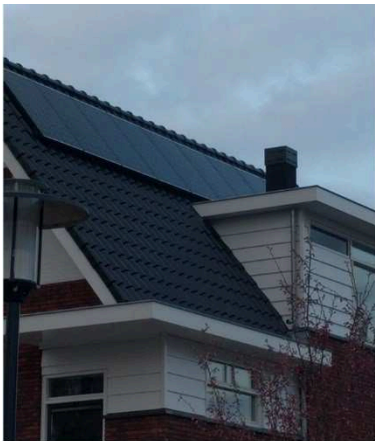
Duurzame energieopwekking zorgt voor een toekomstbestendige woning.