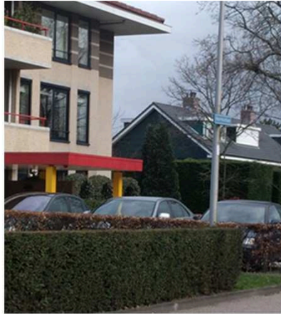
Door het camoufleren van auto's met een haag ontstaat er een fraai natuurlijk beeld.