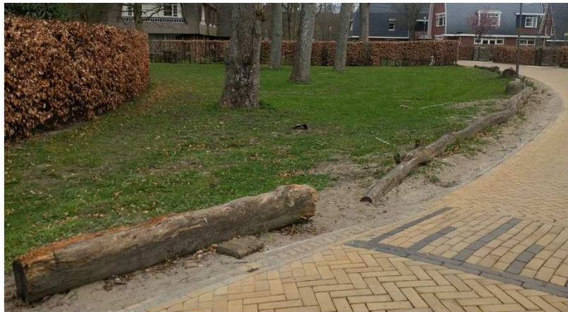
Natuurlijke materialen verouderen op een mooie manier. Beschadigde stalen of betonnen afscheidingen worden veel lager gewaardeerd dan bijvoorbeeld hout.